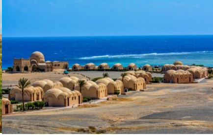
Marsa Shagra (Egyiptom)