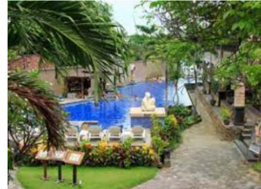
Bali (Pelangi Bali)